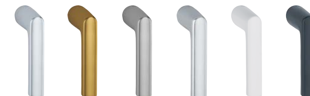
F1 aspetto argento F4 aspetto bronzo F9 aspetto titanio F94-1 aspetto cromo satinato F9016M bianco traffico opaco F9714M nero opaco