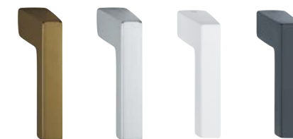
F33-1 aspetto bronzo medio opaco F94-1 aspetto cromo satinato F9016M bianco traffico opaco F9714M nero opaco